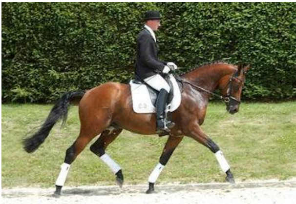
Nachtruf von INTERCONTI