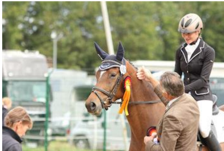
Zauberstern von KASIMIR TSF