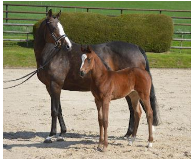
Fohlen Donjagara v. NIAGARA