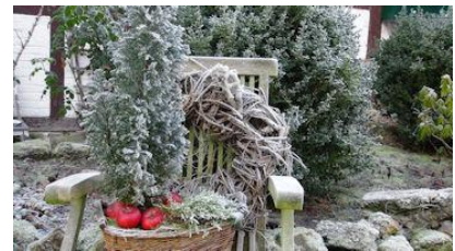
Impressionen zum Nikolaustag!