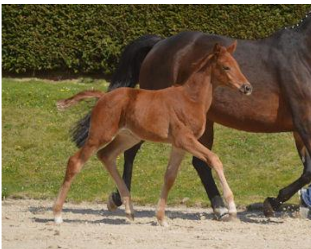
Fohlen Nachteule v. NIAGARA