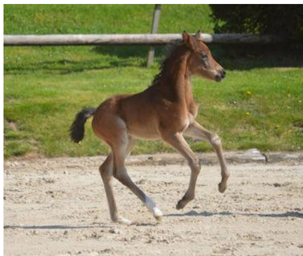
Fohlen Zaubernote v. NIAGARA