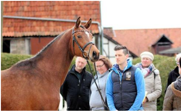
3-jährige Stute Nachtfürstin v. INTERCONTI, Herzruf

Eine auch für uns sehr fruchtbare Veranstaltung!! Wir bedanken uns bei allen Beteiligten für das Interesse und die vielen Anregungen und bei der Delegierten des Hessischen Zuchtbezirkes Alexandra Becker für die übersandten Fotos.