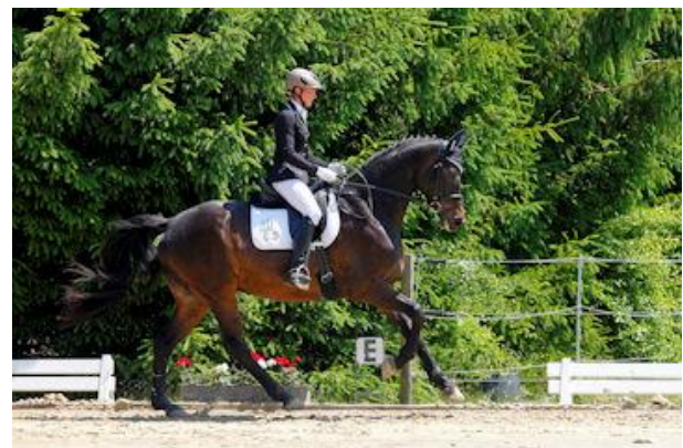
Zauberfunke von INTERCONTI