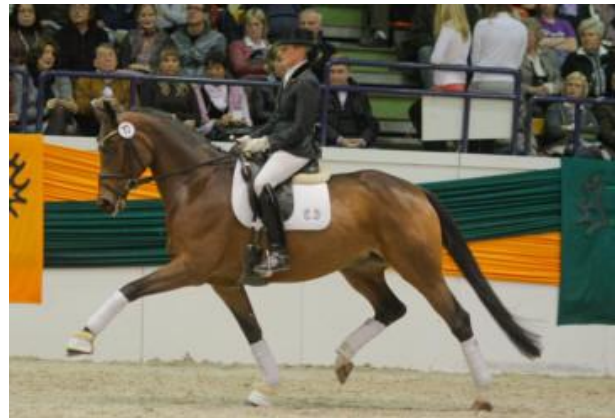
Nuschka v. E.H. TAMBOUR